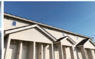
アパートタイプの新しい寮です。(女性優先)