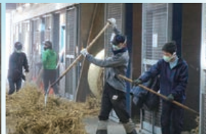
作業の仕方を一から教えますので、未経験でも大丈夫です!