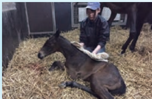
サラブレッドがこの世に生を受ける瞬間に立ち会えます。