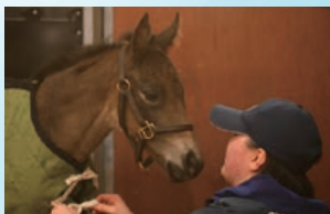
白老ファームでは、心身ともに誕生を支え、小さな芽を健やかに育むステージです。