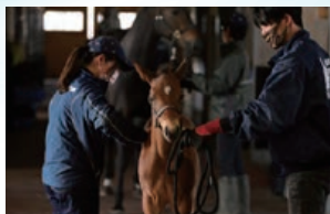
座学や実技講習、担当馬のプレゼン大会などの研修で様々な観点から「馬」を学べます。