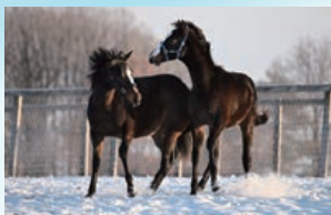
白老ファームイヤリングでは、心身ともに強く健やかな競走馬へと導きます。