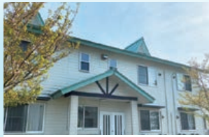
各寮、無料Wi-Fi完備。米子市街まで車で約20分(イオンモールまで15分)