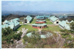
施設...ウオーキングマシン、トレッドミル、坂路コース、ダートコースなど。