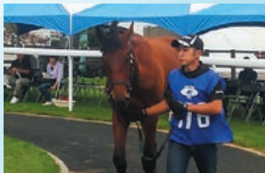
生産や騎乗育成だけではなく、コンサイナー業務も行います!