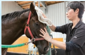
若い世代が大多数を占めて、頑張っています!