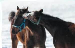
冬の厳しい寒さでも、馬たちは元気一杯!