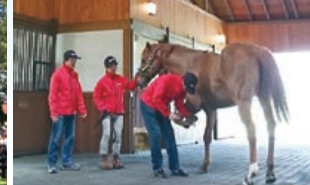
当牧場が誇るスタリオン厩舎。ファンに人気のゴールドシップなどが管理されています。