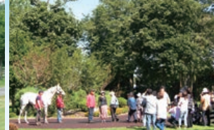
年間を通じて多くの方にご来場いただき、場内には明るい声が響きます。