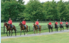
業界トップクラスのハードトレーニングが基本方針です。