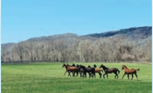
牧場の敷地は約515ha。その大部分は広大な放牧地が占めております。