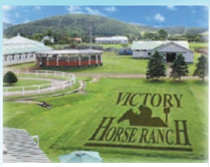
ドローンを飛ばして撮ってみました。