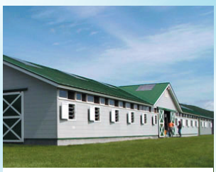
馬の管理がしやすいように設計された厩舎です。ので、仕事もしやすいです。