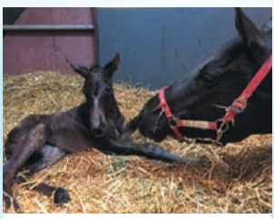
希望があれば、生産現場に携わることができるのも、総合牧場ならでは。