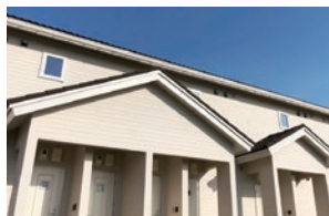
アパートタイプの新しい寮です。(女性優先)