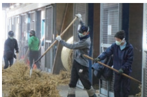
作業の仕方を一から教えますので、未経験でも大丈夫です！