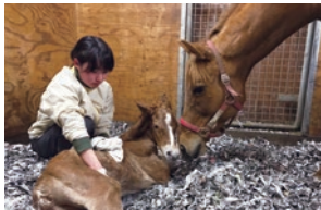
サラブレッドがこの世に生を受ける瞬間に立ち会えます。

開業から26年と歴史の浅い牧場ではありますが、馬も人も日々課題に向き合いながら、世界と戦える馬づくりに励んでいます。当牧場で生産・育成した馬には、ゴールドアリュール、ハットトリック、フェノメノ、ペルシアンナイト、ルヴァンスレーヴ、サングレーザー、ルックトゥワイスらの活躍馬がいます。ご興味のある方は、ぜひお気軽にお問合せください。