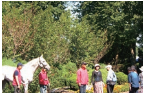
年間を通じて多くの方にご来場いただき、場内には明るい声が響きます。