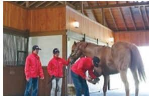
当牧場が誇るスタリオン厩舎。ファンに人気のゴールドシップなどが管理されています。