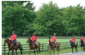
業界トップクラスのハードトレーニングが基本方針です。