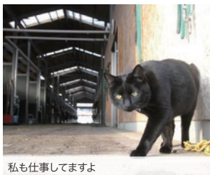
私も仕事してますよ