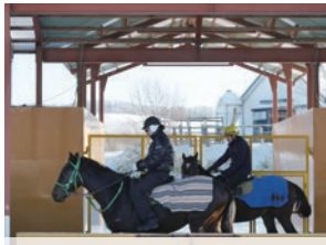
冬季屋内トラックコース

社宅は家庭用一戸建て、単身者用ワンルーム(各部屋バス・トイレ付き・男女別)。労災とは別に業務災害保証にも加入しており、万が一の怪我にも十分な補償をしております。随時、インターンシップの受け入れをしております。(宿泊施設・食事付・交通費・各交通機関へスタッフが送迎) スタッフ一人ひとりが常に向上心を持ち、怪我のないように働いています。