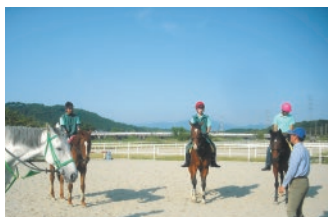
近郊乗馬クラブでの練習風景です。基礎乗馬をしっかりと学びます。