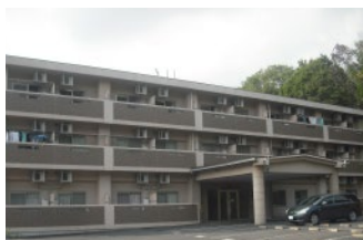
寮の部屋は個室でバス・トイレ付。無料Wi-Fiも完備。社員食堂もあります。