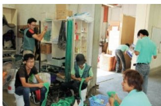
厩舎作業もみんなでワイワイ楽しくやっています。