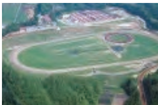
ノルマンディーファーム小野町(福島県小野町)当グループ関係馬の外厩としての役割を担います。