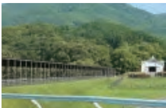
ノルマンディーファーム(新ひだか町静内)騎乗育成部門の核となるトレーニング施設です。