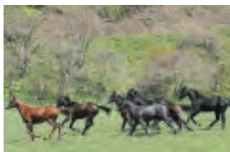
えりも分場(えりも町歌別)1歳馬の中期育成拠点。若駒の合宿所的な役割を担います。

人馬ともにハッピーな生活を送れるよう、育成環境の充実とアットホームな環境づくりに邁進しています。