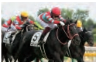
自分たちの手で育てた馬が活躍する瞬間！国内外のGIレース観戦研修があります。