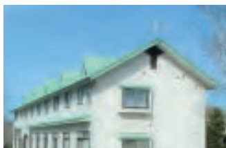
牧場敷地内には男子寮、女子寮があり、食堂では専属スタッフが食事を提供します。