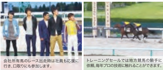
会社所有馬のレース出走時は社員も応援に行き、口取りにも参加します。